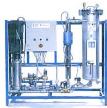
Brauchwasser-Aufbereitungsanlage BRA für Tankstellen und Werkstätten