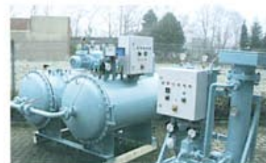
Bilgewasser-Entöler 2000 (Restölgehalt < 5 ppm) und Kraftstoffpflege für ein AIDA - Schiff

Diese Anlagen sind ein Ausschnitt aus dem Schaffen des Jubilars.