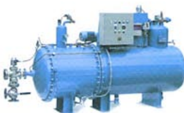
2004, der erste Bilgewasser-Entöler der Welt nach IMO MEPC 107 (49)